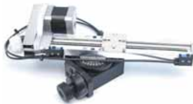
手动旋转表和机动工作台