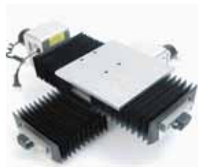
用两个旋转编码器的配合安装来实现螺旋轴的扩展