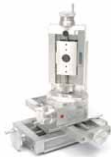
测量中等负载行程的四轴系统