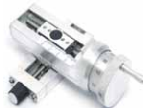
选择螺钉控制定位