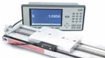
选择 1 或 5 \mu\text{m} 分辨率的线性编码器